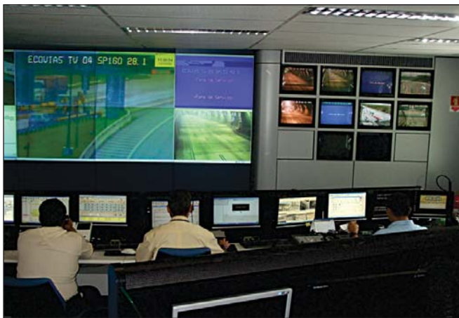
Figura 3: Central de monitoramento

5.10.4 A central de monitoramento (controladora) do sistema de circuito interno de TV deve ter vigilância habilitada durante todo o período de funcionamento diário do túnel.