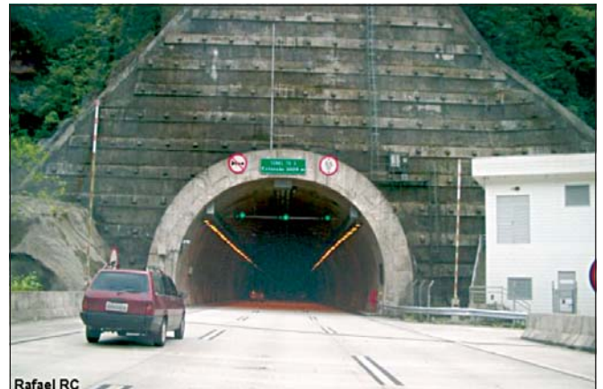
Figura 2: Sinalização na entrada do túnel